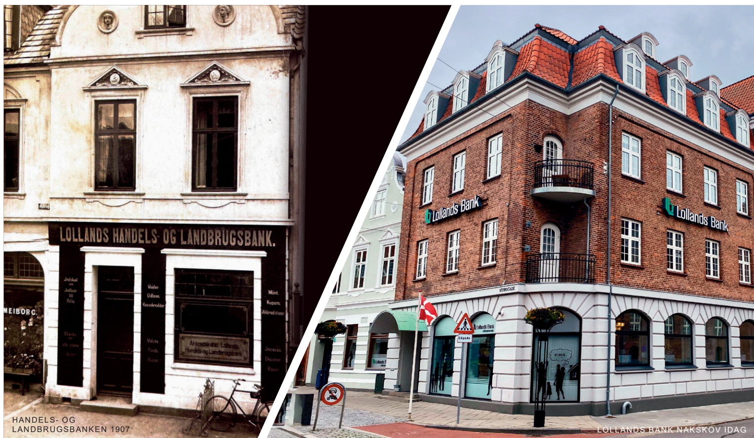
HANDELS- OG LANDBRUGSBANKEN 1907

For Lollands Bank består det essentielle i, at banken stræber efter at gå bæredygtighedsvejen selv. Derfor ansatte banken i 2023 ansat en ESG-ansvarlig for at kunne leve op til vores ambitioner. Banken vil derfor i de kommende år tage initiativer til selv at blive mere bæredygtige, for herigennem at sikre en kontinuerlig udvikling.