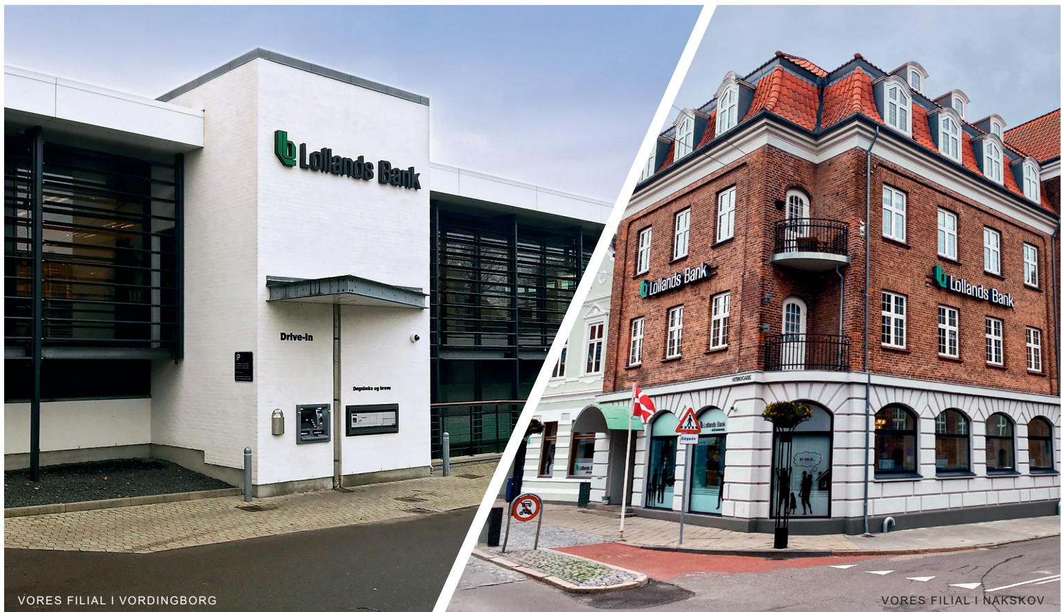
VORES FILIAL I VORDINGBORG

I 2025 vil ESG risici blive indarbejdet, som en del af bankens samlede risikovurdering.