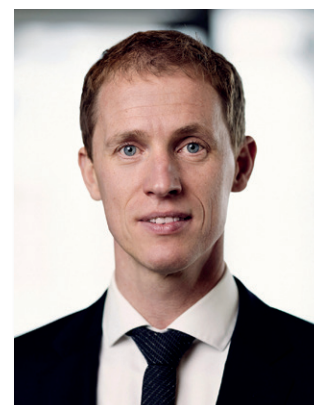
Chief Sustainability Officer i BankInvest

Retningslinjerne bygger på en trafiklysmode, hvor ”røde” selskaber ekskluderes, ”gule” selskaber udfases frem mod 2030 (emerging markets-fonde dog 2035) og ”grønne” selskaber inkluderes i investeringsuniverset, så længe de og deres omstillingsparathed lever op til en række objektive kriterier.