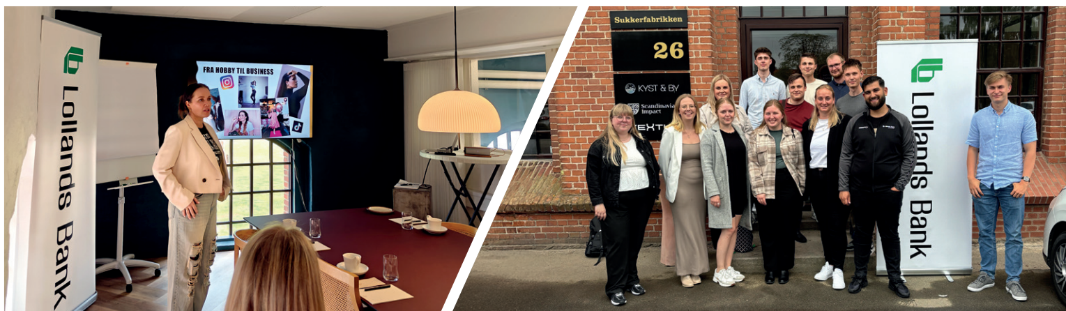
Tabel 9 – Nøgletal på socialt ansvar