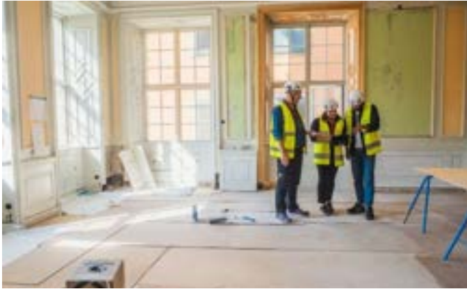
Kollegor; Platsledning under pågående renoveringsprojekt i Gamla Stan, Stockholm.

För att främja ökat engagemang är det av yttersta vikt att alla medarbetare känner sig inkluderade och delaktiga. Under den gemensamma konferensen i december 2023 hölls en workshop med fokus på inkludering och kommunikation, genomförd av "Sila Snacket". Ett arbete som kommer att följas upp under kommande år. Genom regelbundna medarbetarundersökningar erhåller bolaget ett arbetsmiljöindex som mäter organisatorisk och social arbetsmiljö. Resultaten från hösten 2023 visade ett arbetsmiljöindex på 82, en siffra som bolaget strävar efter att bibehålla och förstärka genom sitt fortsatta arbete inom detta fokusområde.