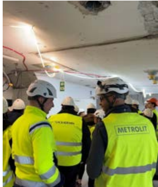
Medarbetare; Studiebesök från yrkeshögskola i projekt

Som en del i det systematiska hållbarhetsarbetet får alla medarbetare göra regelbundna hälsoundersökningar. Yrkesarbetare erbjuds de lagstadgade medicinska kontroller och samtliga yrkesarbetare omfattas av en sjukvårdsförsäkring. Alla anställda har tillgång till företagshälsovård.