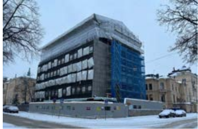
Projekt; Totalrenovering av fastighet där vi bevarar material i hög utsträckning.

Metrolit Byggnads arbetar aktivt med att komma högre upp i avfallshierarkin och vi strävar i första hand efter att minimera vårt avfall. Bevarande och återanvändning är en del av processen av cirkulära materialflöden inom byggbranschen. Vi eftersträvar en styrning mot en cirkulär värdekedja i stället för en linjär. Vi anser att den bästa byggnaden är den som aldrig rivs. I de fallen där bevarande inte fungerar fullt ut har vi lagt fokus på att få i gång bolagets återbruksprocesser. Vi har flertalet processer och planer där vi kan vara våra beställare behjälpliga i cirkuläritets- och återbruksfrågan.