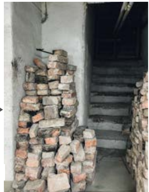
Figur ovan, Metrolits Återbrukstrappa