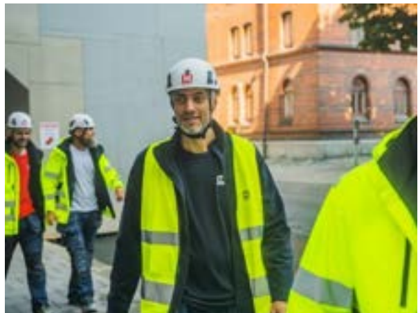
Medarbetare i projekt, här inom affärsområdet City & Kulturfastigheter

Metrolit Byggnads hållbarhetsstyrning ska säkerställa åtagande mot sina intressenter för ett långsiktigt värdeskapande för kunder, medarbetare, leverantörer, ägare samt övriga intressenter i samhället. Genom uppföljning och utvärdering av indikatorer och nyckeltal arbetar Metrolit systematiskt med ständiga hållbarhetsförbättringar. Våra styrdokument lägger grunden i vårt hållbarhetsarbete inom de fyra olika fokusområdena miljö, sociala förhållanden och personal, mänskliga rättigheter och antikorruption.