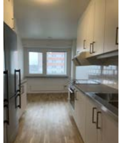
Projekt; stambyte och renovering av lägenheter i flerbildshus, en stor del av vår verksamhet.

Ett viktigt steg i arbetet mot en sundare konkurrens i byggbranschen är att vi själva som verksamhet har arbetskraften inom bolaget. På Metrolit har vi flertalet yrkesarbetare inom vår organisation och ute i våra projekt och det är vi stolta över att presentera.