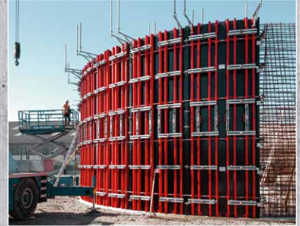
Rund-, Stützen- und Säulenschalung