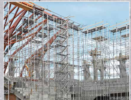
Aufstiege & Arbeitsgerüste