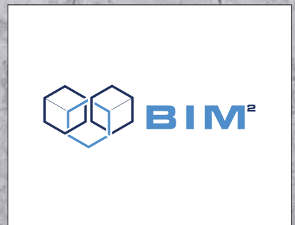
BIM & Planung