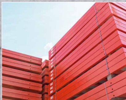
Miete & Regeneration