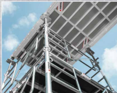
Traggerüste & Baustützen